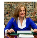
Dña. Carmela Silva

Excm. Presidenta de la Diputación Provincial de Pontevedra